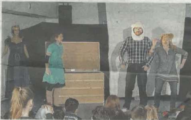
La reine, la princesse et les deux doudous dans la pièce "Dépossédé(s)".

GÉMOZAC. La compagnie Dakatchiz poursuit sa tournée des collèges du département, avec une halte au collège Jules Ferry.