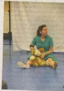
La compagnie Dakatchiz fait le tour de plusieurs collèges pour créer une pièce sur les violences intrafamiliales.