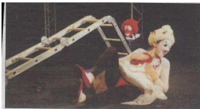
250 enfants ont assisté au spectacle de Dakatchiz.

(1) Entrée libre. Avec le soutien de la Communauté de communes de Haute Saintonge, la Ville de Montendre, La Maison Pop'et la Maison solidarité jeunesse.