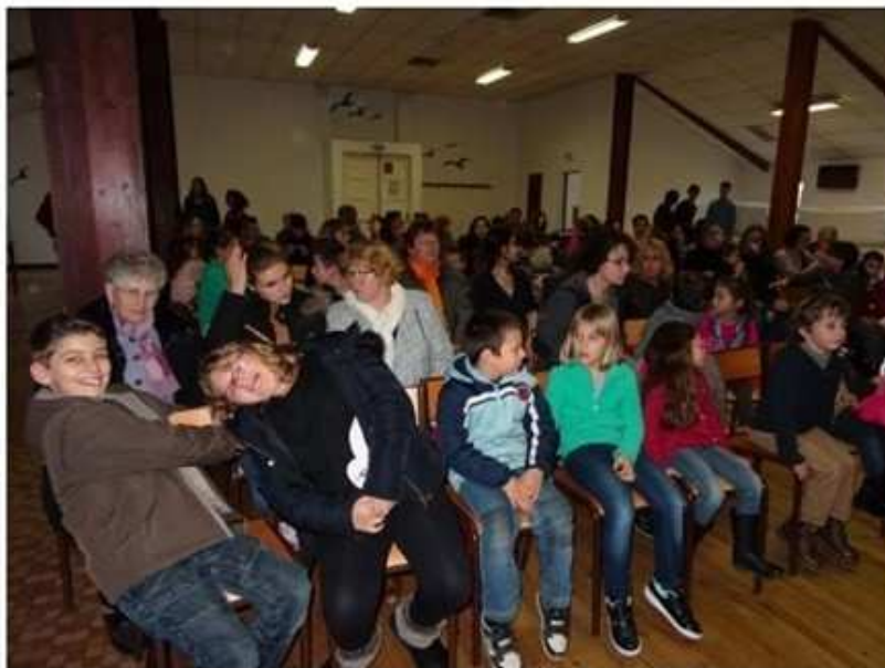
Les enfants du RPI et du centre de loisirs de Montendre sont venus nombreux.

Les écoles des communes de Courpignac, Salignac-de-Mirambeau, Chamouillac et Rouffignac sont regroupées en RPI. Au sein de ce RPI, tout ce qui n'est pas pédagogique : ramassage scolaire, cantine, ménage, garderie ... est géré par un SIVOS.