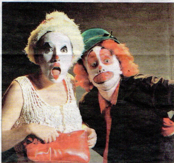
Gil et Zut est un spectacle de clowns pas comme les autres.

Avec Gil et Zut, il s'agit de confronter le clown « traditionnel » au « nouveau clown », plus proche des émotions mais non moins drôle.